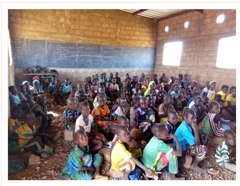
TRACE 03 · MARIE-JOACHIM · PREMIERS TEMPS

Des élèves, des bénévoles, des partenaires et des amis se mobilisent. Les premières pierres sont posées. Une école commence à prendre racine.