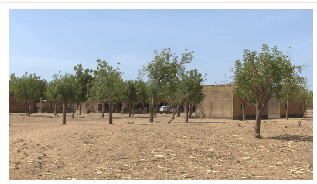
TRACE 05 · SITE, ARBRES ET BIEN COMMUN

L'enjeu n'est pas seulement d'aider Lengo. Il est d'accompagner un village vers plus d'autonomie, pour qu'un jour ce qui grandit ici puisse aussi inspirer ailleurs.