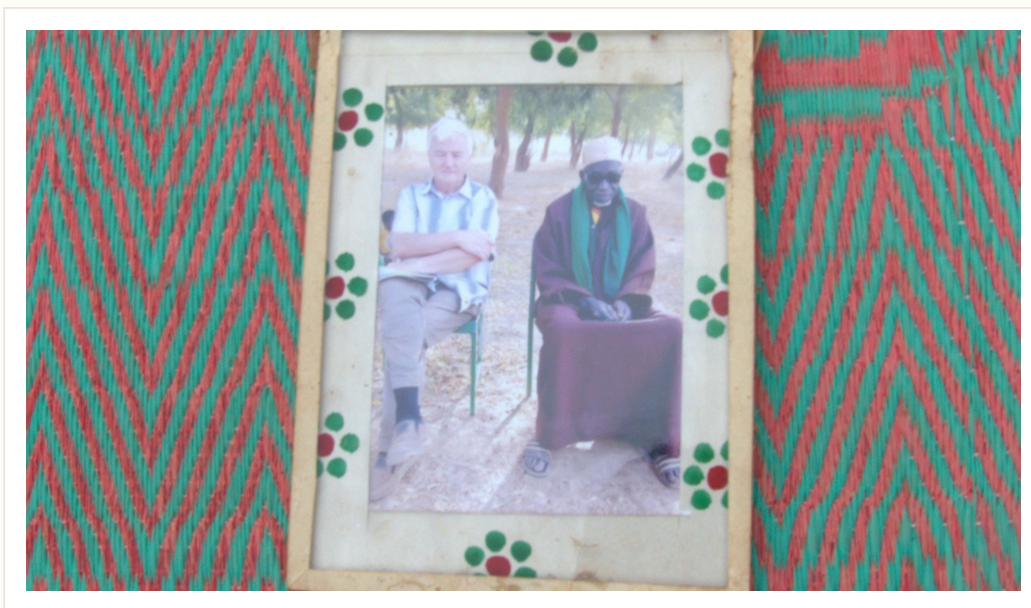
ARCHIVE 02 · RENCONTRE · LENGO

Mariam Faso naît de ce mouvement-là : reconnaître une demande venue du terrain, y répondre avec d'autres, et construire une relation qui dure.